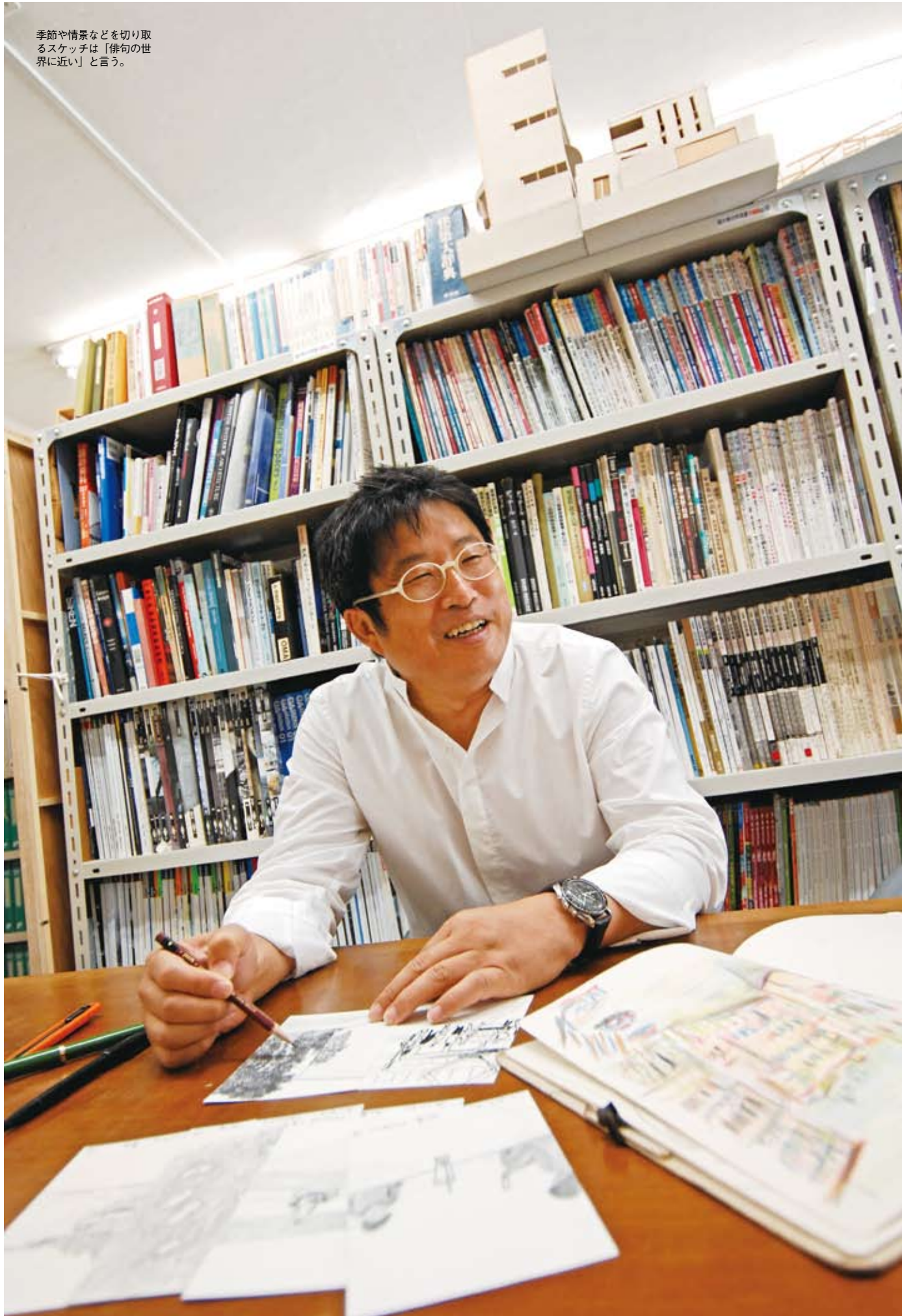
季節や情景などを切り取るスケッチは「俳句の世界に近い」と言う。